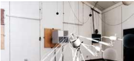
ANGCSILLAPÍTÓKON VÉGZETT ÉRÉSEK KUSZTIKA