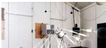
ANGCSILLAPÍTÓKON VÉGZETT ÉRÉSEK KUSZTIKA