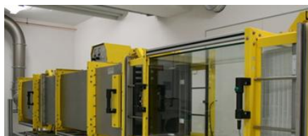
LEGMAGASABB ELVÁRÁSOK LAPJÁN ZŰRŐ TECHNOLOGIA