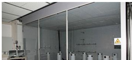
TESZTELŐ ÜZEMEK LEVEGŐELOSZTÁSI TECHNOLOGIA