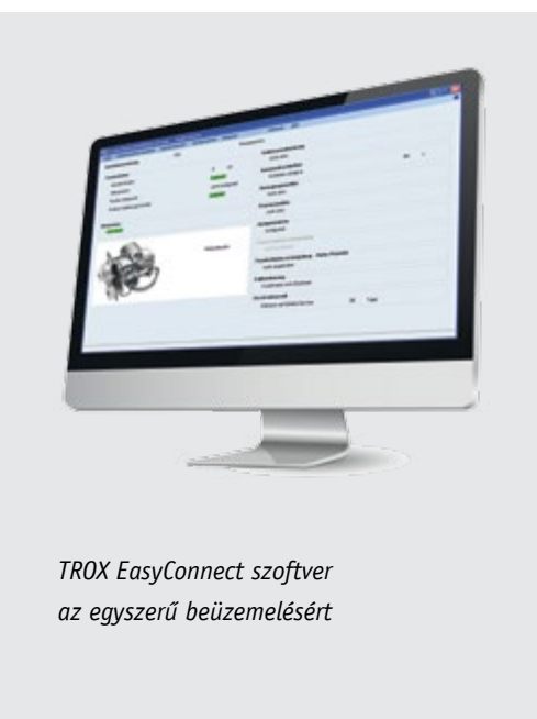
TROX EasyConnect szoftver az egyszerű beüzemelésért

Moduláris felépítésének köszönhetően a szabályozó minden esetben a felhasználó igényeire szabható. Opcionális lehetőségek széles palettája áll rendelkezésre pl. LON, BACnet, Modbus jelátalakító, melynek segítségével a rendszer a megrendelői igénynek megfelelően a helyi épületfelügyeleti rendszer alá rendelhető. TROX EASYLAB segítségével Ön pénzt és időt takarít meg.