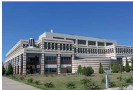
Sabancı Eyyetem, Isztambul