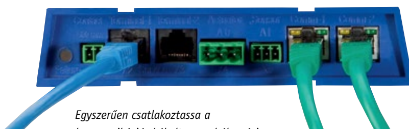
Egyszerűen csatlakoztassa a kommunikációs kábelt a szabályozási rendszer létrehozásához