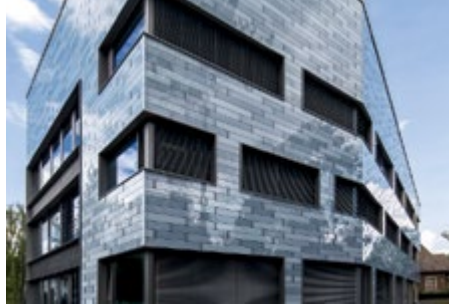
Max Delbrück Centrum, Berlin